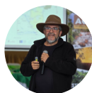
Washington Gaibor Ecopar